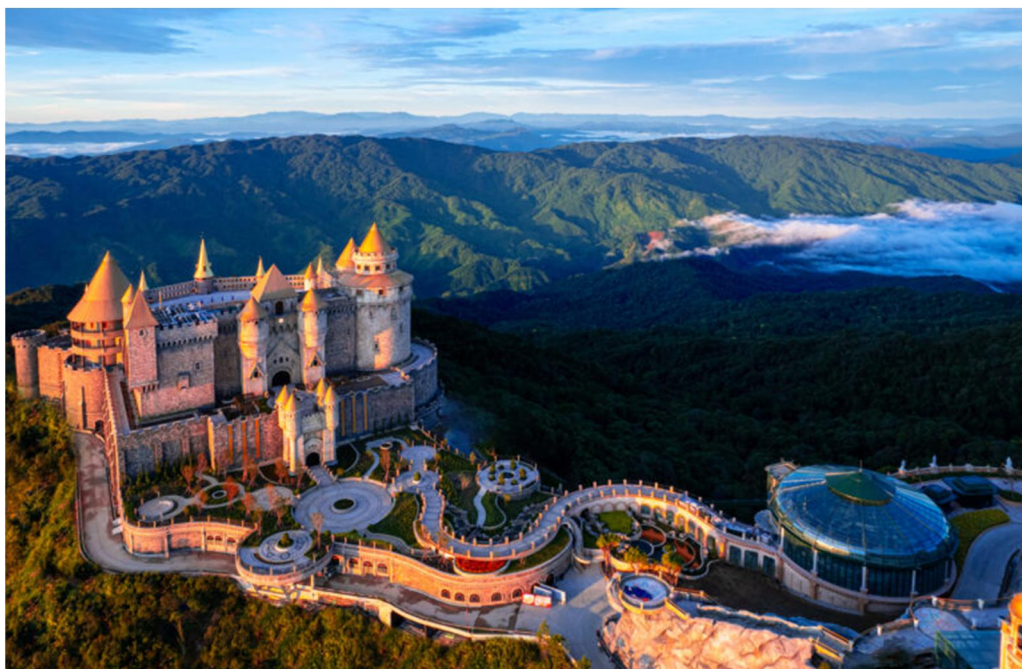
Hình 3. Một góc Sun World Ba Na Hills - Đà Nẵng

sẽ mang đậm sắc màu văn hóa Phật giáo, Đà Nẵng cũng đã có thêm Công viên châu Á - Asia Park. Các chuyên gia của Tổ chức Giải thưởng Du lịch Thế giới World Travel Awards đánh giá Sun World Ba Na Hills hoàn toàn có tiềm năng để cạnh tranh với Disneyland Tokyo, Nhật Bản.