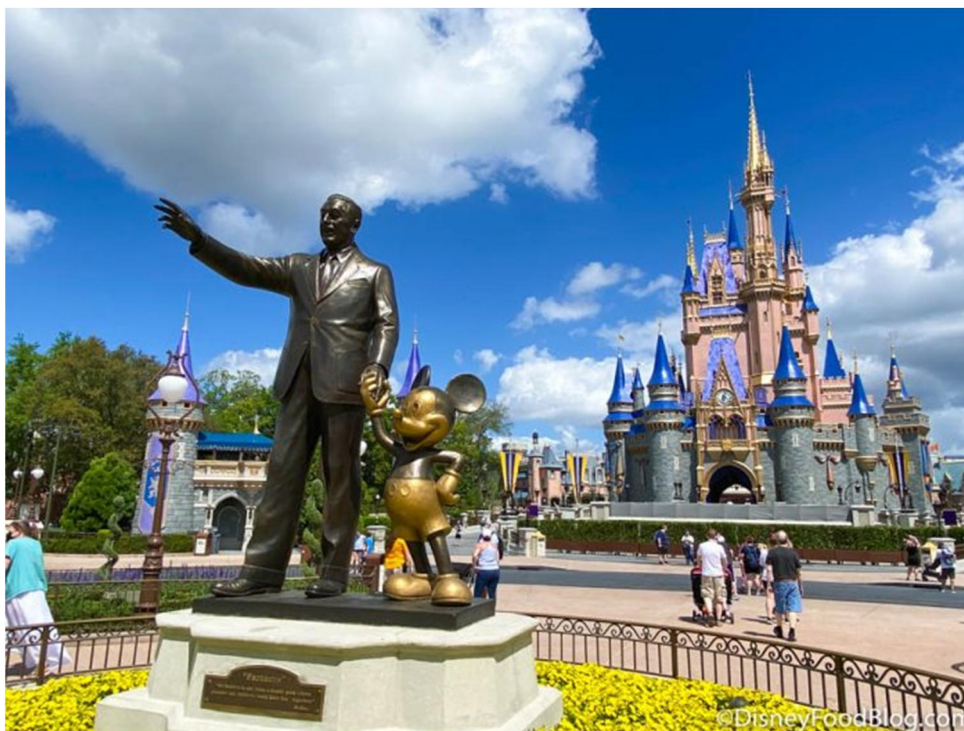
Hình 1. Một góc Công viên giải trí Walt Disney World - Magic Kingdom