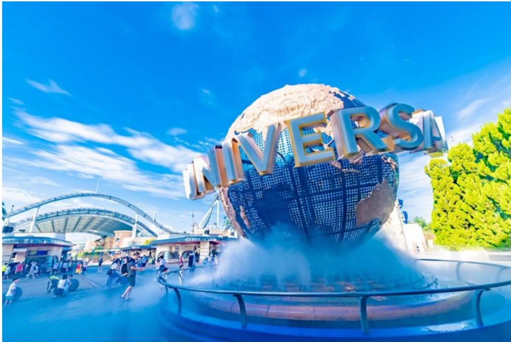
Hình 2. Biểu tượng Công viên giải trí Universal Studio Japan